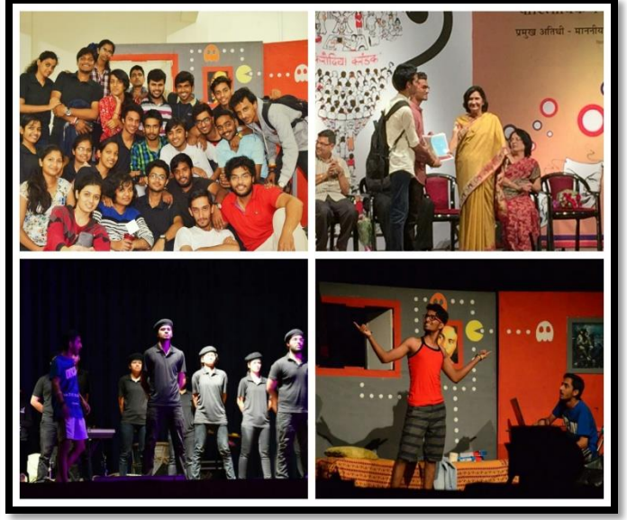
Award winning team of "Pustak" in Firodiya Karandak 2k16