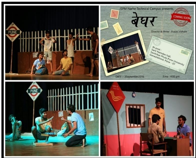
"Beghar" Performance in University Karandak 2k16 by Art circle group