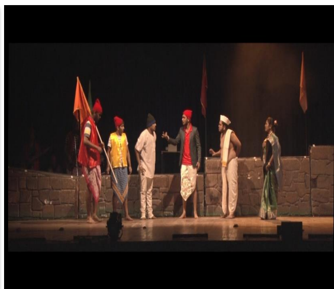
"THARNI" Semifinalist in Firodiya Karandak 2k19 by Art circle Group