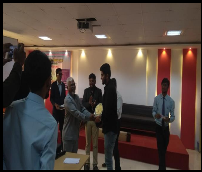
First prize in Dowsing event organized by PVPIT