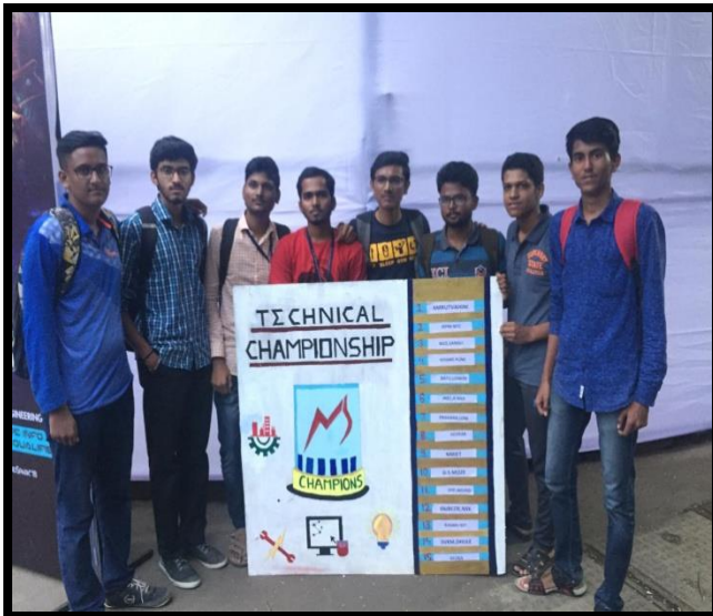
Third prize in Mind Spark'18 Technical event organized by Coep.