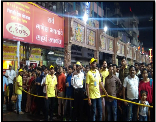
"POLICE MITRA" – Student Volunteers of JSM NTC helping Police in Crowd Management during Ganpati Festival.