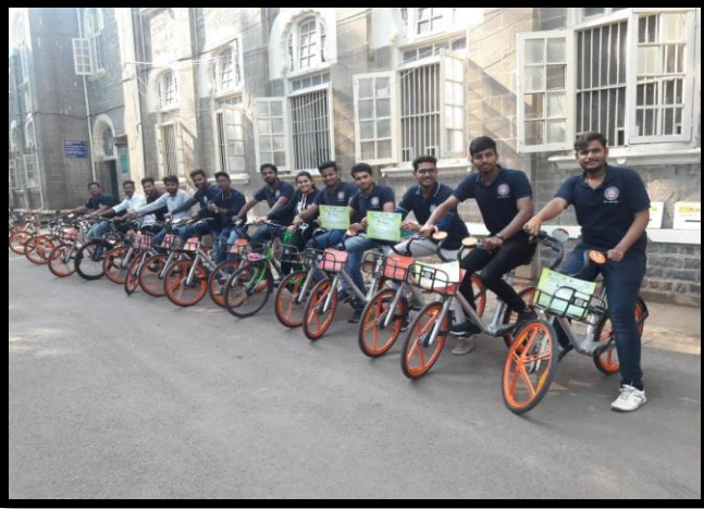
Organ Donation awareness rally Cyclothon at SP college Pune.