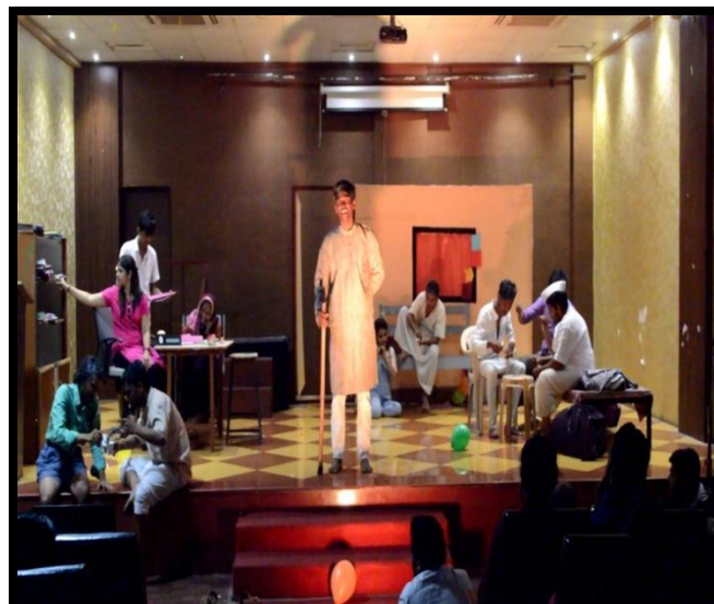
"Parva Dusre" Performances in Dajikaka Karandak 2k17 by Art circle Group