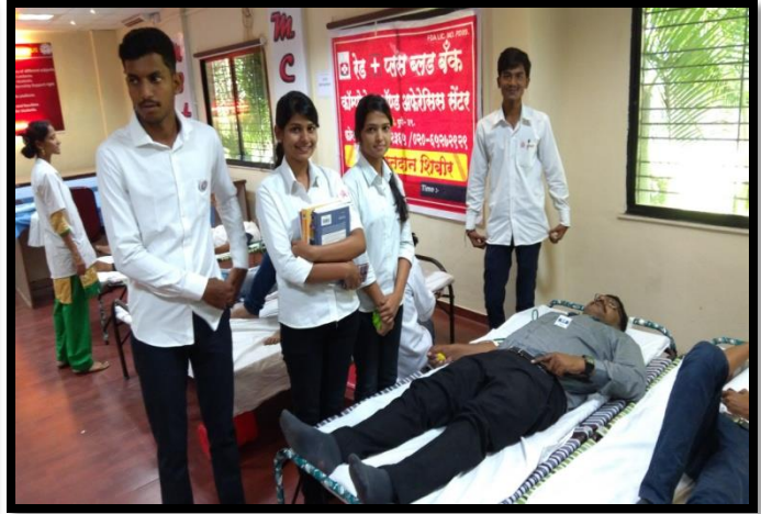
Blood Donation Camp in JSPM NTC