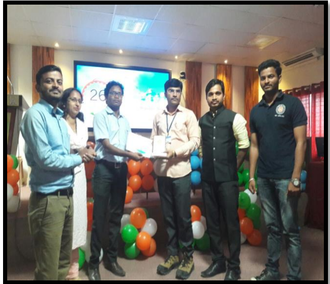
First Prize for Speak for Nation Organized by NSS.